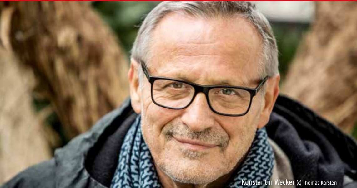
Konstantin Wecker